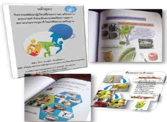
ภาพที่ 1 เล่มเอกสารหลักสูตรกิจกรรมพัฒนาผู้เรียน

2. การสร้างเอกสารประกอบการใช้หลักสูตร โดยผู้วิจัยได้จัดทำเอกสารประกอบการใช้หลักสูตร ซึ่งประกอบไปด้วย 1) ข้อเสนอแนะในการทำกิจกรรมตามภาระงาน 2) สื่อที่เป็นใบงาน ใบความรู้ เว็บไซต์ วีดิทัศน์ ตามแผนการจัดกิจกรรมตามภาระงาน 3) เกณฑ์การประเมินผลตามภาระงาน ซึ่งเป็นรูบรีค (Rubric) โดยทำครบทุกหน่วยและทุกกิจกรรมดังตัวอย่างในภาพที่ 1